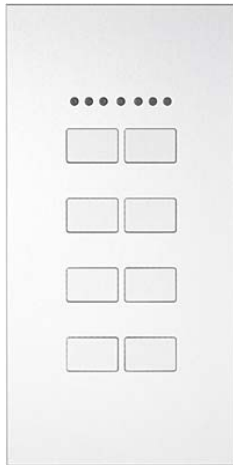
Frontansicht Largho R8

Largho Typ R sind Designtableaus mit integriertem Raumtemperaturregler. 7 LEDs in einer Reihe angeordnet signalisieren die Sollwertverstellung und die Betriebsart des Reglers. Der Temperaturmesswert steht dann auf dem KNX-Bus als Objekt zur Verfügung.